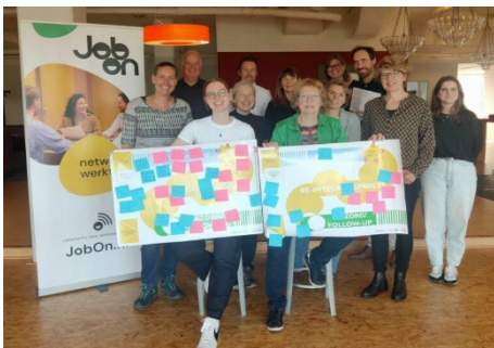
Deelnemers van de fysieke sessies met het project team